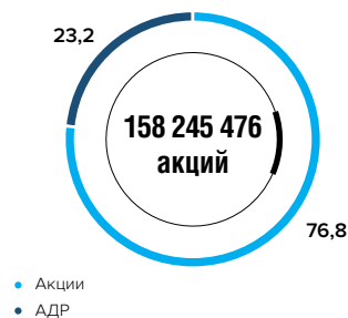
РАСПРЕДЕЛЕНИЕ АКЦИЙ И АДР НА 31.12.2020 (%)

Акции Компании входят в базу расчета ключевых отечественных и ряда зарубежных индексов.